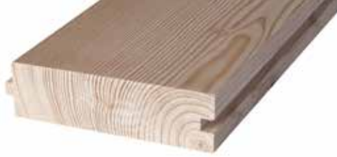
Massive Diele Doga massiccia