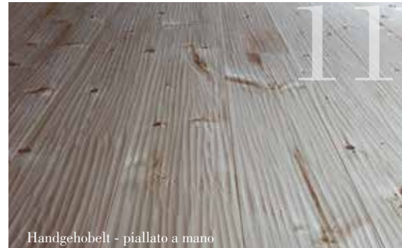
Handgehobelt - piallato a mano

B esondere Oberflächen: Unda und handgehobelt. In einem aufwändigen und innovativen Verfahren geben wir der Oberfläche ein besonders wertiges Aussehen.