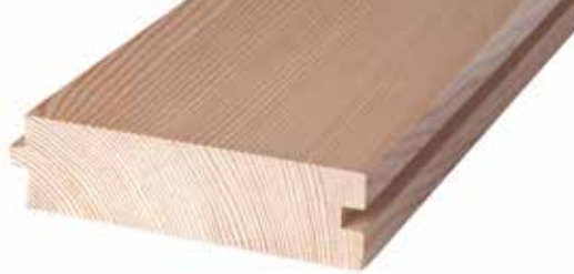
Massive Diele Doga massiccia