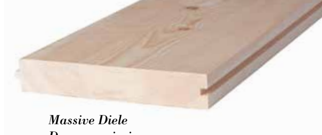
Massive Diele Doga massiccia